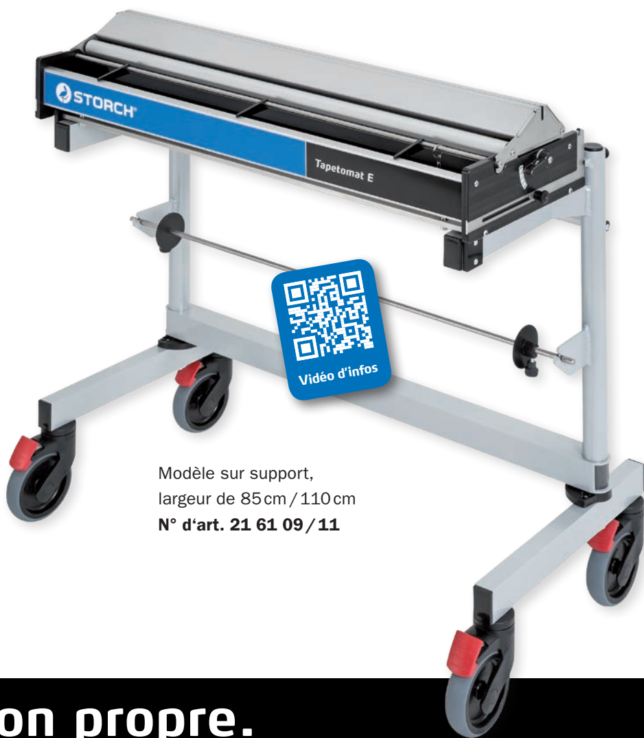
Modèle sur support, largeur de 85 cm / 110 cm N° d'art. 21 61 09 / 11