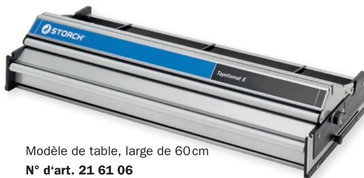
Modèle de table, large de 60 cm N° d'art. 21 61 06