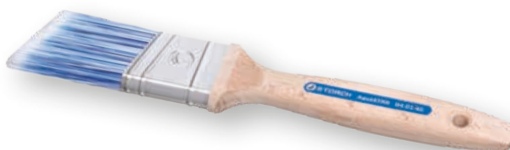
Brosse à recharger AquaSTAR La brosse parfaite, la finition parfaite.