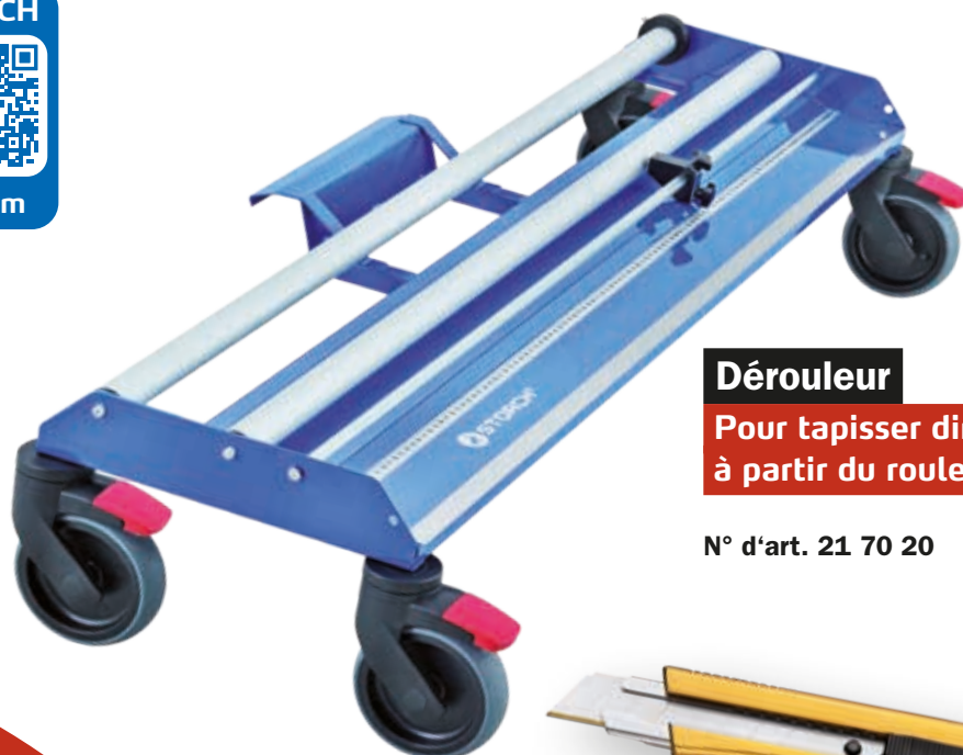
Dérouleuse Pour tapisser directement à partir du rouleau