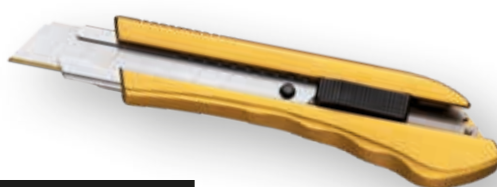
Cutter Goldcut® Tranchant, sûr, ultrastable.