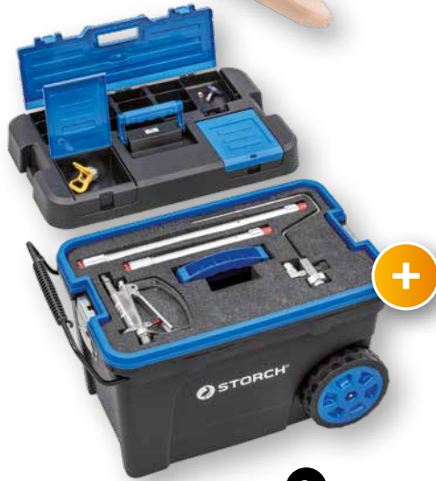
Trolley LeOS Projection à faible retombées. Transport flexible.

+ DuraSTAR 21 (N° d'art. 14 24 25) (non ill.) + DuraSTAR 12 (N° d'art. 14 30 25) (non ill.) + FineSTAR 15 (N° d'art. 14 08 25) (non ill.) N° d'art. 69 45 70