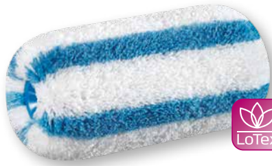
DuraSTAR 21 L'expert des angles grossiers