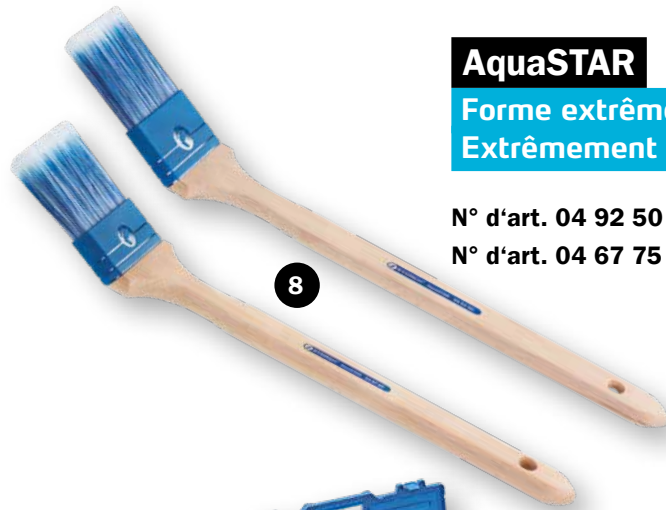
AquaSTAR Forme extrêmement stable. Extrêmement durable.