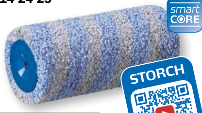
FineSTAR 15 Restitution élevée. Finition fine.