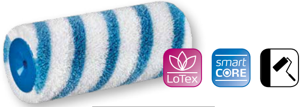
DuraSTAR 12 Très performant sur surface lisse