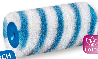
DuraSTAR 21 Couvrir encore plus de surface rugueuse