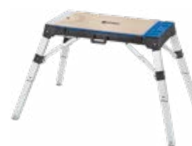
Table polyvalente. Sert de plateforme de travail, d'établi ou de planche à roulettes. Réglable en hauteur 3 paliers, jusqu'à 80 cm. Plan de travail 95 cm x 46,5 cm réversible. Très robuste, supporte des charges de jusqu'à 150 kg.