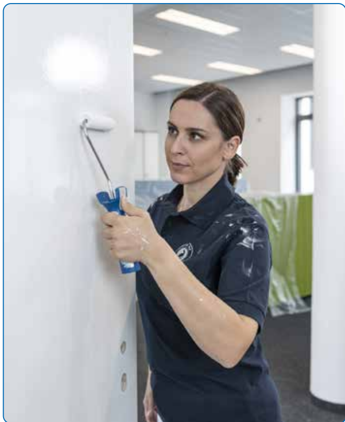
Une surface de recouvrement supplémentaire grâce au dispositif LoTex.