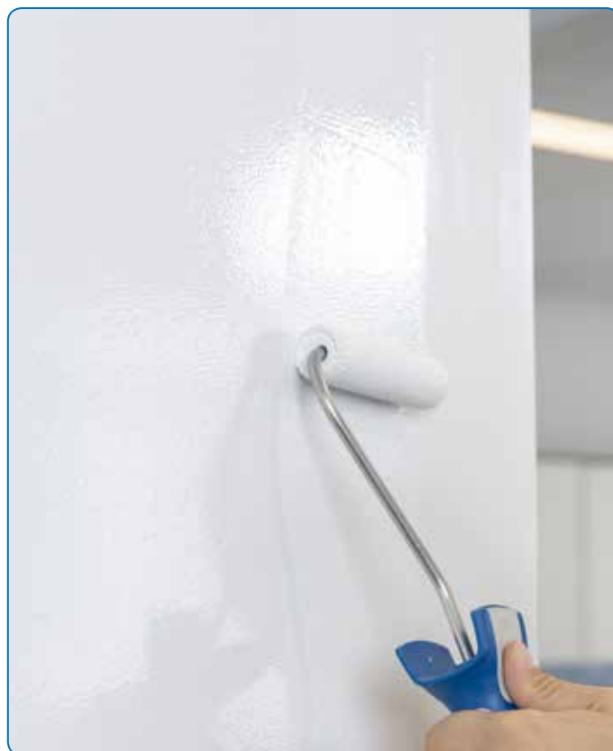
Répartition optimale du matériau sur les surfaces.