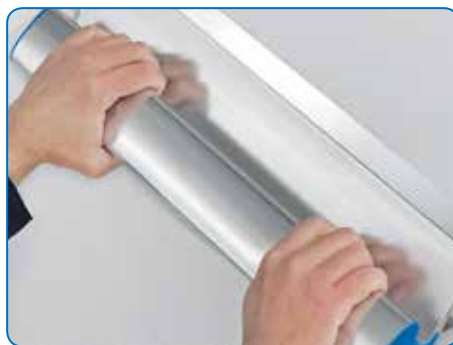
Guidage à deux mains et donc nécessitant peu d'efforts pour les largeurs importantes