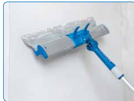
L'adaptateur FlexoGrip Alustar pour la perche télescopique LOCK-IT est disponible séparément pour le travail facile des plafonds ou autres surfaces murales en hauteur sans échelle