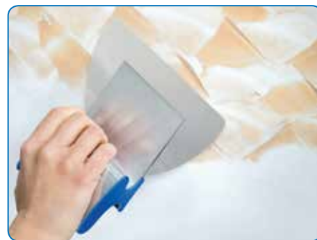
Les largeurs plus réduites sont aussi idéales pour des techniques décoratives de qualité