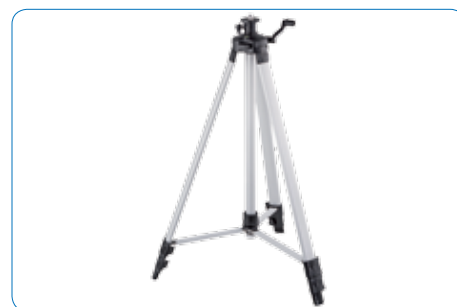
Trépied jusqu'à 1,8 m de hauteur avec filetage de trépied 5/8"