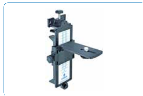
Support mural avec filetage de trépied 5/8"