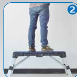
Surface de travail.