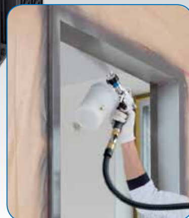
Utilisation à 360° - même en haut

Pour peindre en toute flexibilité dans toutes les directions